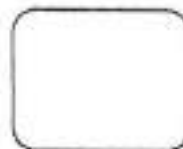
HUELLA DIGITAL ÍNDICE DERECHO